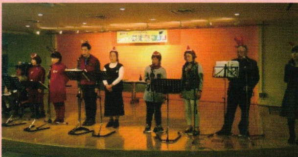
岐阜市障害者生活支援センター「あんさんぶる♪」