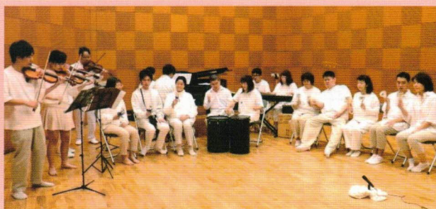
岐阜県自閉症協会+ぎふの森学園